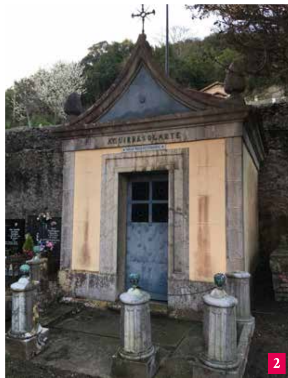
Aguirre Solarte kapera