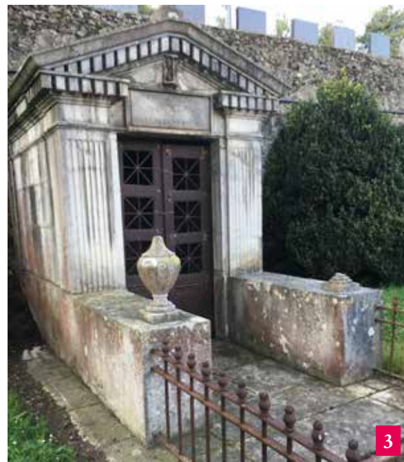
Uribarren Aguirrevengoa kapera