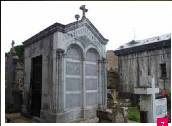
Oxangoiti (Arriola/Lertxundi) hilobia