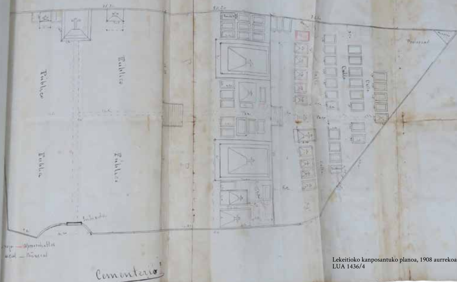
Lekeitioko kanposantuko plano, 1908 aurrekoa. LUA 1436/4