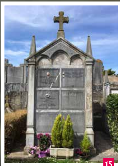
Aremayo (Erkiaga/Salinas) hilobia