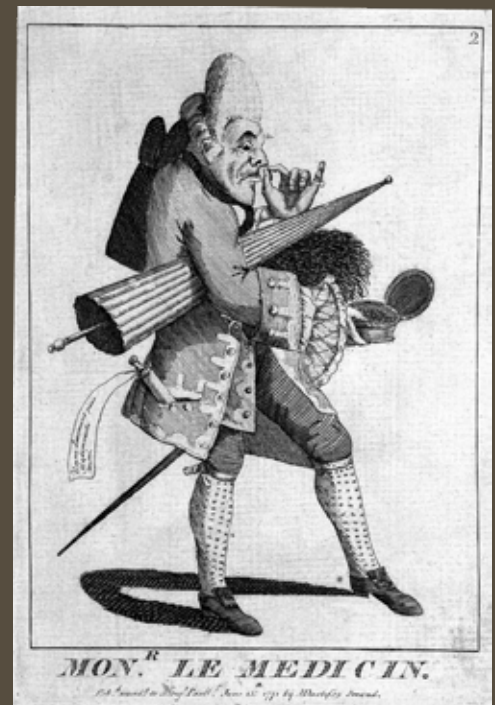
"Monr. Le Medicin" M. Darly, 1771. Wellcome Collection. Medikatu macaroni baten satira.

Lekeition egon zireneko urteei buruz esan dugunari gehitu behar diogu ikasketak izango zituelako edo... hainbat dokumentutan agertzen dela Agustin abokatu antzeko jardueretan (prokuradore, administrari, kuradore, maiordomo, negozio-gizon...). Badakigu aita eta anaia botikariak izan zirela eta seguruenik anaia hil zenean 1714an haren botikarekin geldituko zen. Ezagutzen ditugu Udalean izan zituen karguak, baita 1719an matxinadaren urtean alkate izan zela ere. Itxuraz orbanik gabeko bizimodua! Dokumentuek, heldu eta erabili ditugunak noski, hori dioskue, zorren bat, besterik ez.