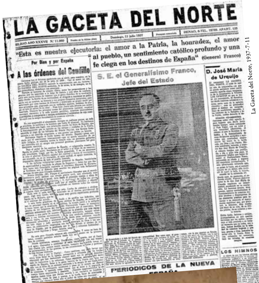
La Gaceta del Norte, 1937-7-11