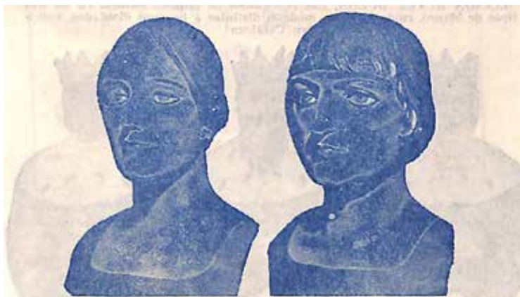
PAREJA GIGANTES, núm. 4. Es de cartón fibron maros, brazos, cabeza y cuerpo hasta la cadera, con refuerzos interiores. Pelucas de cartón imitando el pelo, con esqueleto de madera de caderas abajo. Altura 330 metros.

Prototipo de Gigantes del mismo modelo de los de Lekeitio ofrecidos en el catálogo de "El Ingenio" de Barcelona. Imágenes sacadas del catálogo A de "El Ingenio" (1951-52). (Fondo: BFAH/AHFB, Municipal, MUNGIA 00329/029).