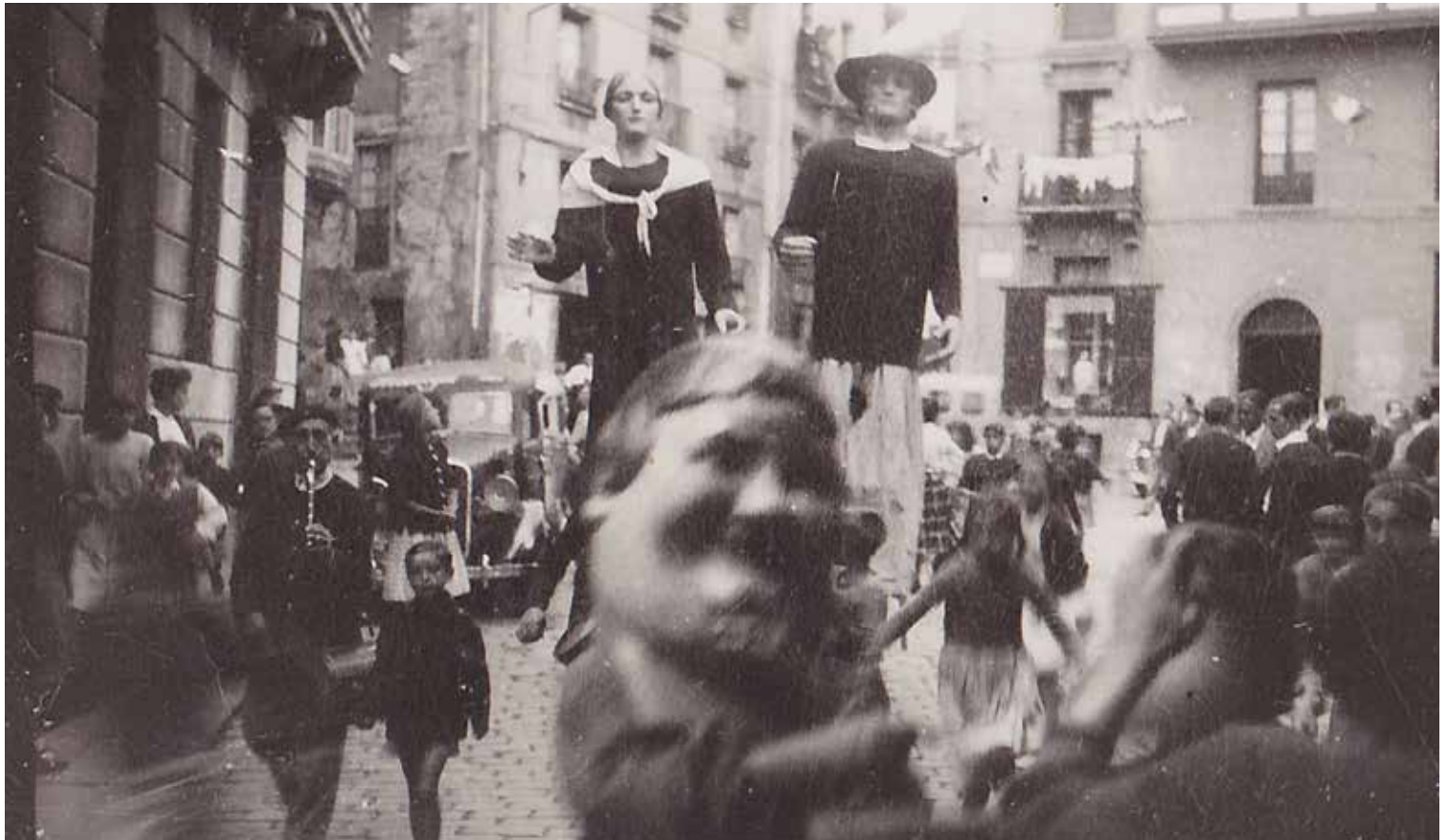
Gigantes y cabezudos en la plaza Gamarra de Lekeitio, años 50?