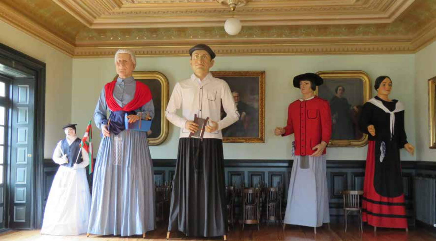
Gigantes en el salón de plenos del Ayuntamiento de Lekeitio.