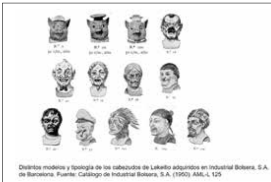
Catálogos de cabezudos de las casas Bolsera, Aragonesa de fiestas, Arca de Noé y El ingenio.