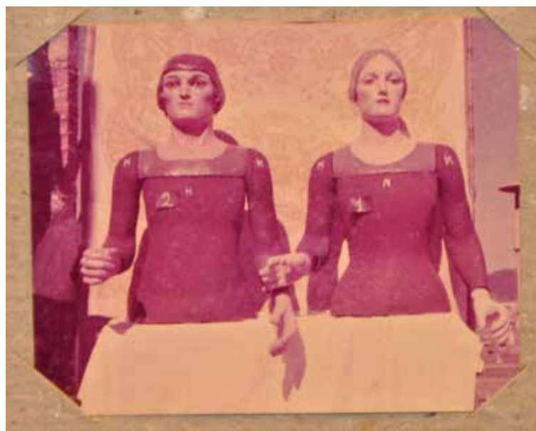
Gigantes en el taller de "El Ingenio" del mismo prototipo de los de Lekeitio.