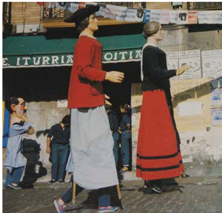
Gigantes de Lekeitio en los años 80. En esta foto aparece Don Terentzio de 1951.

No fue hasta el año 1951 que se produce la compra de Don Terentzio y Doña Tomasa por parte del Ayuntamiento de Lekeitio a Industrial Bolsera S.A. Sabemos que en Barcelona se compraron las 2 cabezas, los brazos y manos de los gigantes, y que fue en Lekeitio donde se confeccionaron los armazones y trajes.