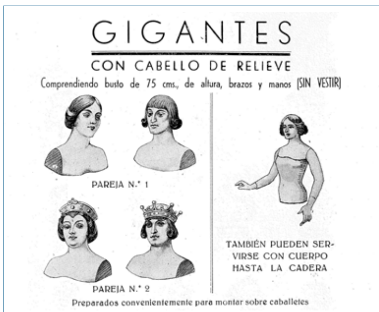
Apartado de Gigantes del catálogo de Industrial Bolsera, S.A. (1950). En Lekeitio según consta en factura se adquiere la pareja Número 1 en 1951. (Fondo: AML-L 125).

Entre la documentación del archivo municipal, hemos encontrado un catálogo de la empresa Industrial Bolsera, S.A. de Barcelona del año 1950. Dicha empresa fue fundada en el año 1919 gracias a la fusión de tres familias del sector industrial que contaban con talleres gráficos. Nació con el objetivo de vender distintos formatos de envoltorios y bolsas de papel.