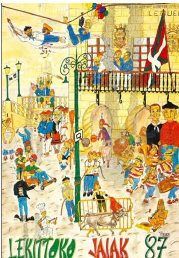
Don Terenzio y Doña Tomasa protagonistas de la portada del programa de Fiestas de San Antolín del año 1987. (Fondo: AML-1097/1).