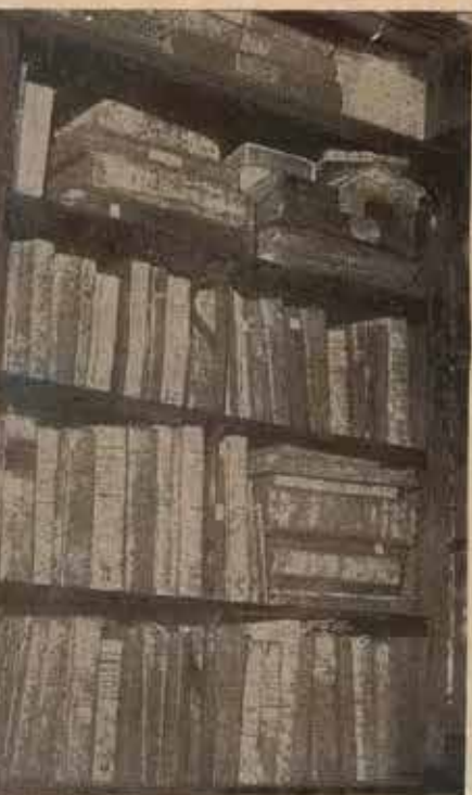
Incunables, viejos folios, pergaminos manuscritos, manjar y edulcorados, privilegios y Fueros, se acumulan en los archivos del Ayuntamiento de Lequeitio

Ensal Montejano Mestres