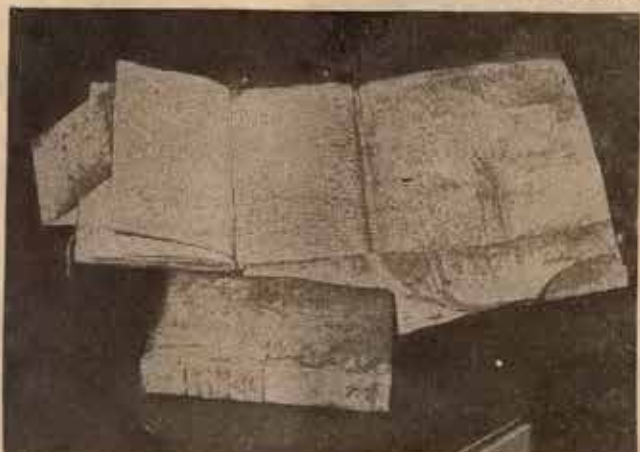
Los pergaminos han sido encuadrados en grandes volúmenes; abiertos sobre una mesa, todavía se pueden observar en ellos las huellas del cilindro de las sellos reales que los reforzaron

Según algunos de ellos, «sólo se podría ser vecino de Lequeitio demostrando la hidalguía»