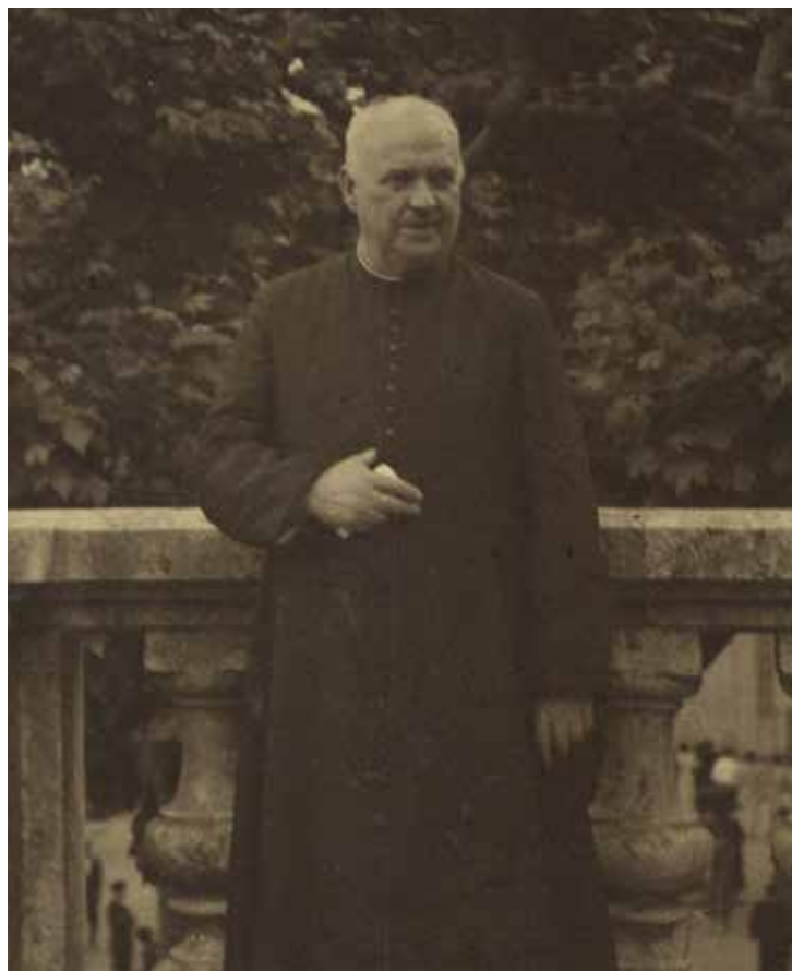
Resurreccion Maria Azkue Lekeitioko udaletxeko terrazan, 1930.

A continuación el Señor Alcalde manifiesta que el próximo día 5 de Agosto se cumple el centenario del nacimiento del ilustre lequeitiano, Don Resurrección María Azcue, 1º Presidente de la Academia de la Lengua Vasca.