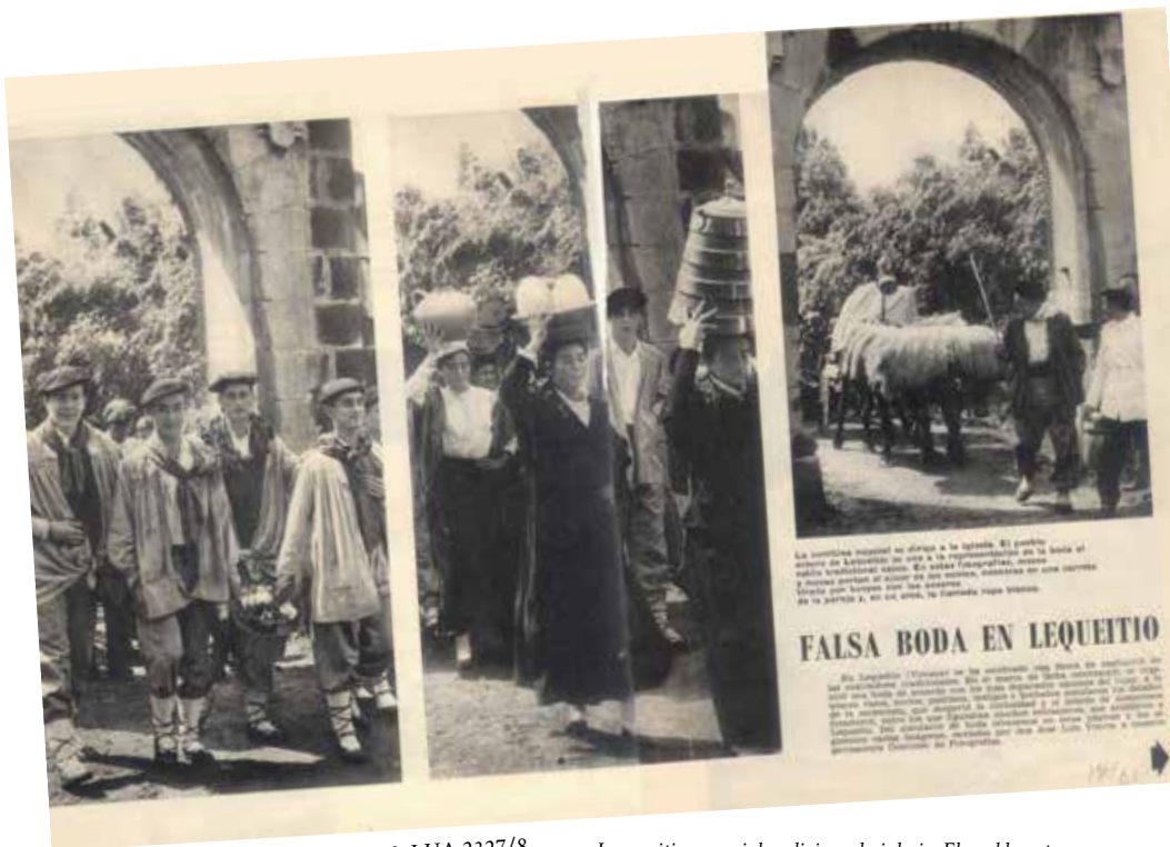
Falsa boda, Blanco y negro, 1964-9-12. LUA 2327/8