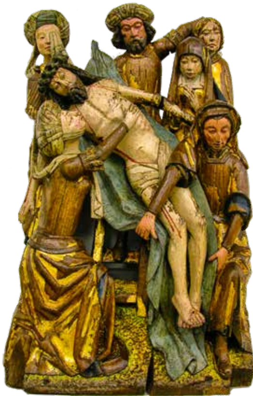
Lekeitioko Andra Mari Zeruratzearen elizako San Gregorio kaperako Pasioaren erretaula flamenkoko eszena, c. 1500