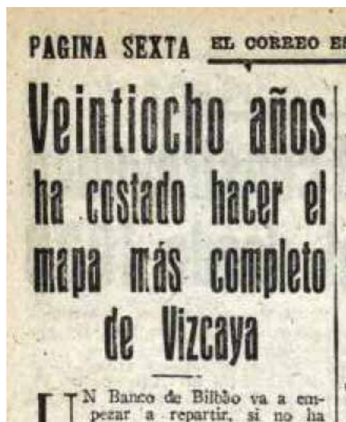
El Correo Español, 1948-1-16

Solapia (Zubiya?) Argaizto Cabopia (Refugio Cañas?) Punta Sanjuanpia Isla San Nicolas Ondarzabal (playa) Playa Carraspio Punta Labagania Ensenada Labagania Punta Artzabal Roca Gastañapia Punta Eguilutz Ensenada Enday