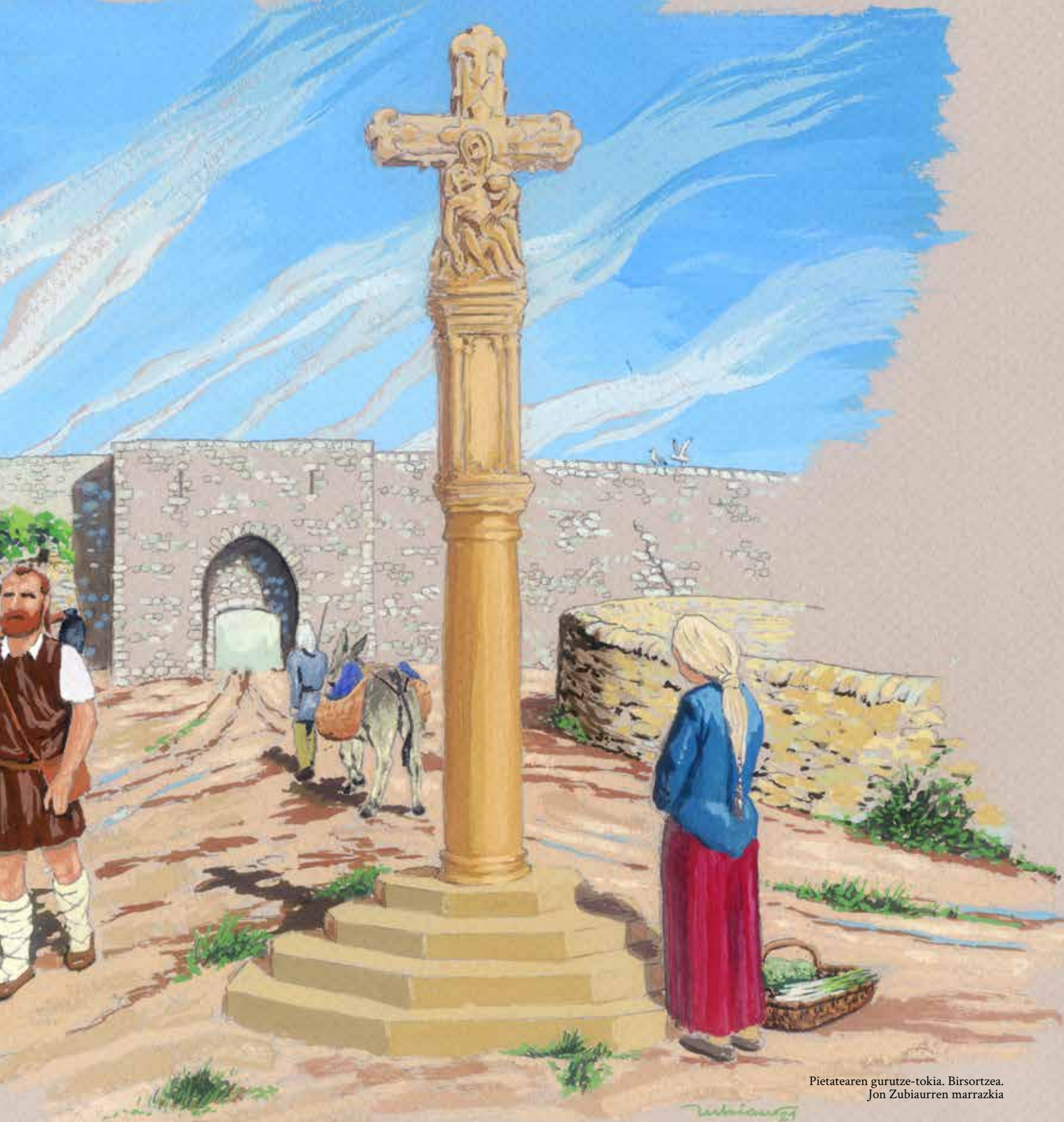
Pietatearen gurutze-tokia. Birsortzea. Jon Zubiaurren marrazkia