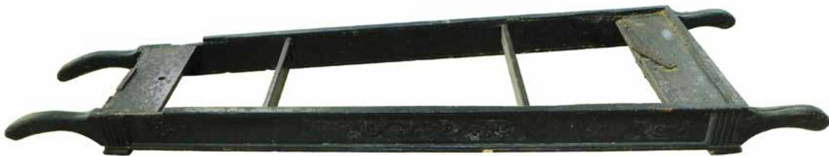
Lekeitioko "anda" XX. mendera arte erabili zirenak hildakoak eramateko.

Amaitzeko komentatu nahi dut ez dela nahastu behar Isuntza zubiko Pilarreko Andra Mariaren gurutze-tokia Santa Elena eta San Roke baselizarekin. Hau XVI. mendeko dokumentazioan “ Yglesia de la Santa Cruz de Esunça ” lez agertzen baita, 1523an “ Ermita de Santa Elena o Santa Cruz ” (41) lez sortua izan zelako.