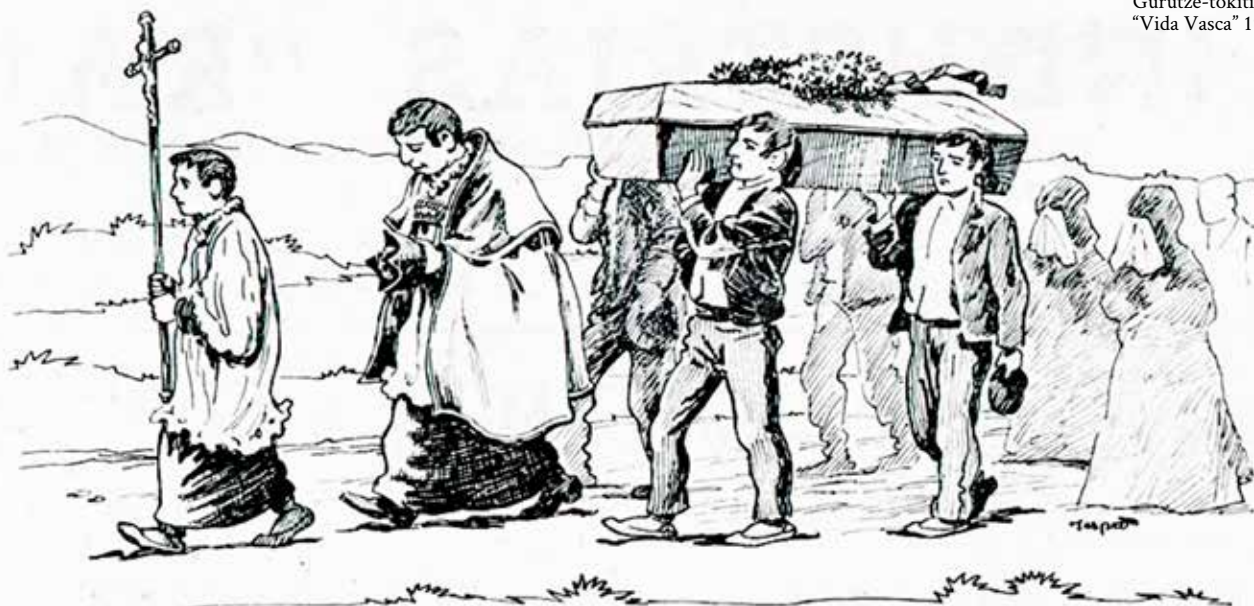
Gurutze-tokitik elizara. "Vida Vasca" 1969.

" el camino y distancia que ay desde la dicha cassa de Çubieta a la yglesia matriz y