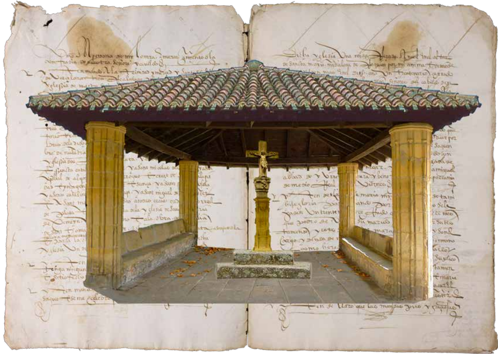
Ateko gurutze-tokia – Birsortzea.