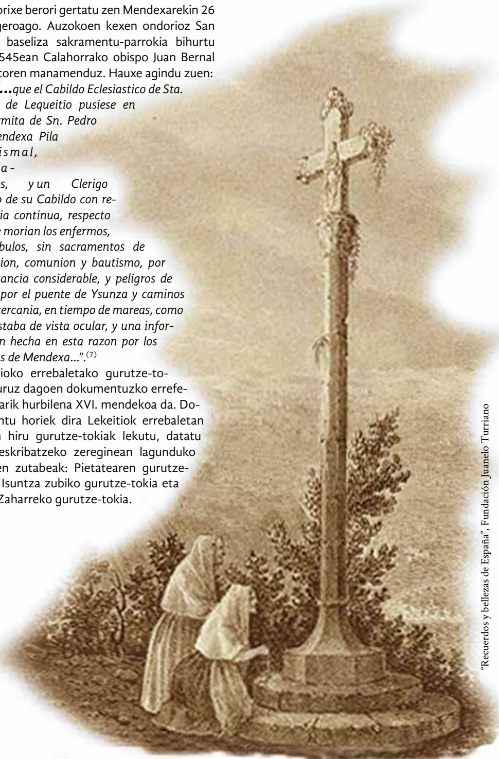
“Recuerdos y bellezas de España”, Fundación Juanelo Turriano

Lekeitioko errebaletako gurutze-tokiei buruz dagoen dokumentuzko erreferentziarik hurbilena XVI. mendekoa da. Dokumentu horiek dira Lekeitiok errebaletan zituen hiru gurutze-tokiak lekutu, datatu eta deskribatzeko zereginean lagunduko diguten zutabeak: Pietatearen gurutze-tokia, Isuntza zubiko gurutze-tokia eta Atari Zaharreko gurutze-tokia.