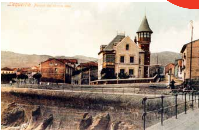
Lequeitio. Parque del rompe olas