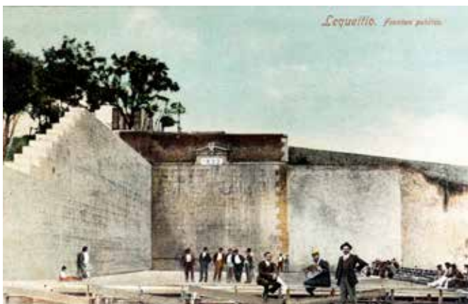
Lequeitio. Fronton publico