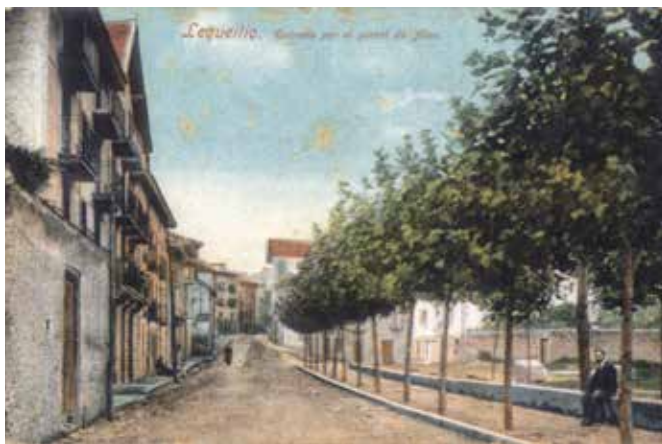
Lequeitio. Entrada por el portal de Atea