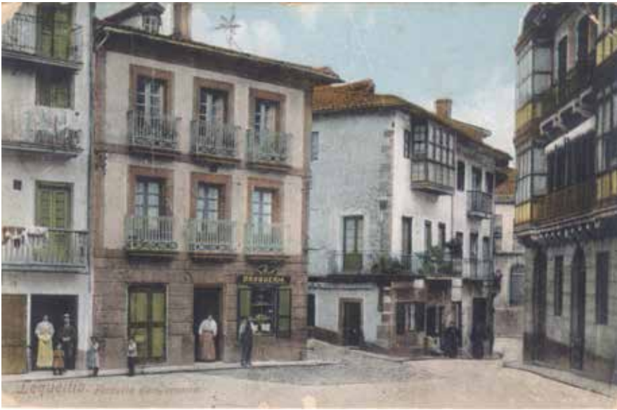
Lequeitio. Plazuela de Gamarra