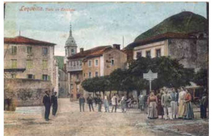
Lequeitio. Vista del Escolape