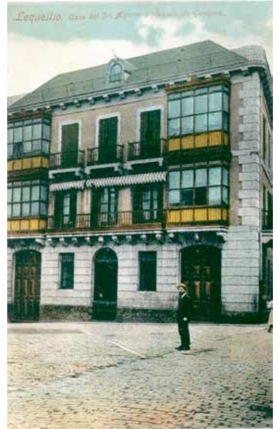
Lequeitio. Casa del Sr. Algorta y plazuela de Gamarra