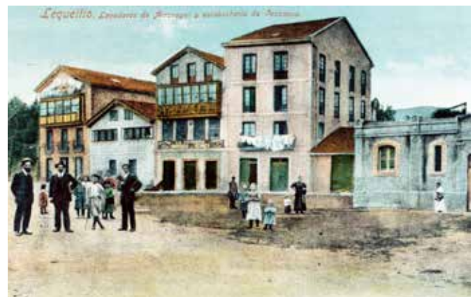
Lequeitio. Lavaderos de Arronegi y escabecheria de Ocamica