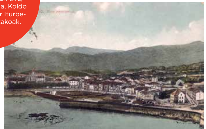
Lequeitio. Vista panoramica