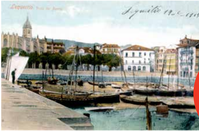
Lequeitio. Vista del Puerto

Erabili ditugun postalak Lekeitioko Udal Artxi- bokoak eta bilduma pribatuetaoak dira, Isaias Gezuraga, Koldo Leniz eta Aitor Iturbe- ren bildumetakoak.