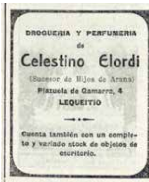
El Pueblo Vasco, 1922-9-13