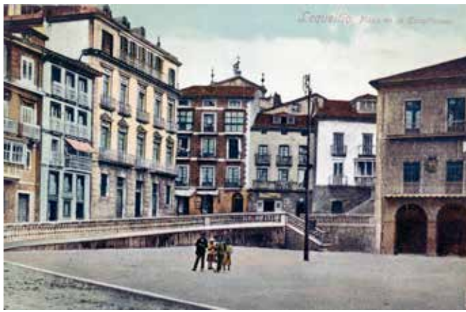
Lequeitio. Plaza de la Constitución