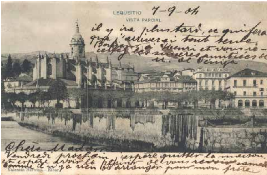
Lehen garaiko postalak