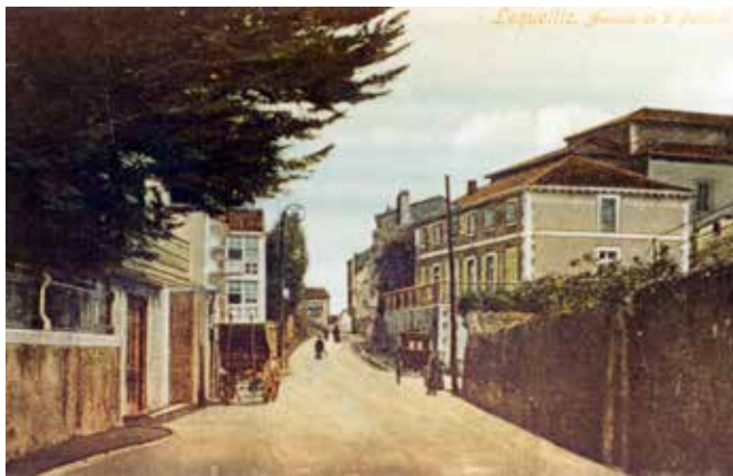
Lequeitio. Avenida de D. Pascual