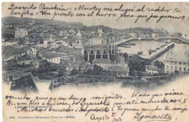
Lequeitio (Vizcaya), Landáburu Hermanas (1903-8-5)