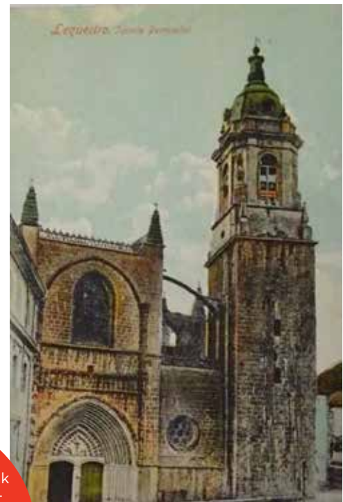
Lequeitio. Iglesia Parroquial