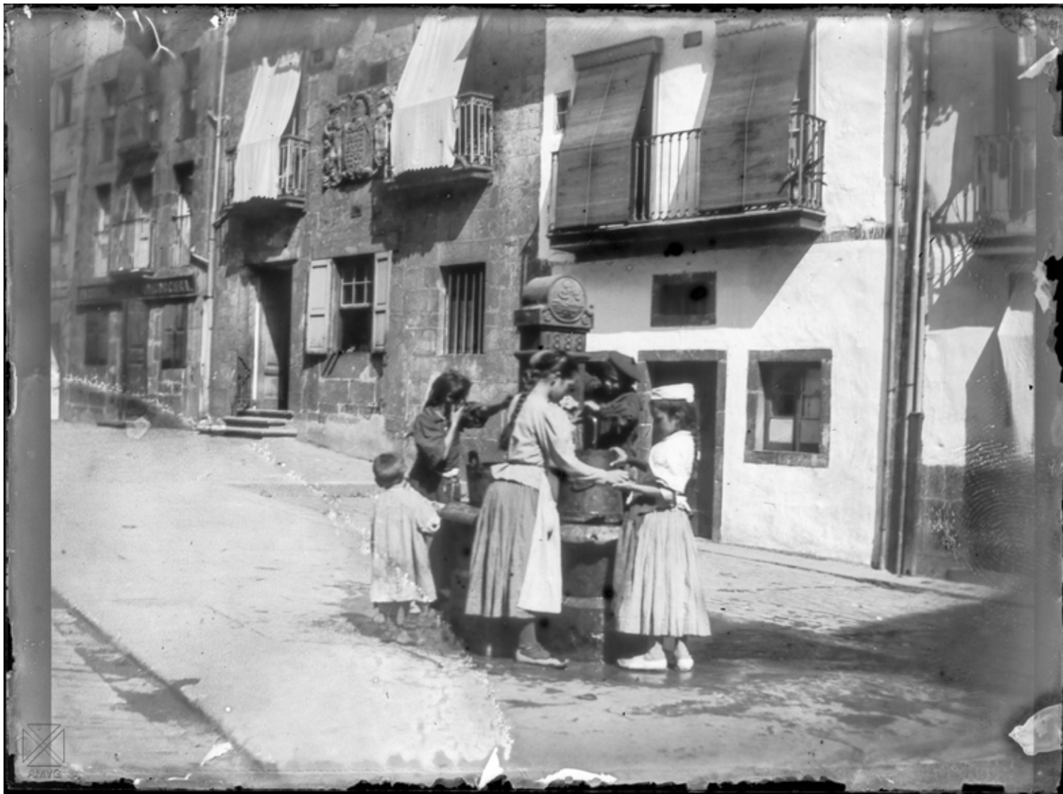
Arranegi Zabaleko iturria, B. Sobrado, c.1925. SOB 9x12-20_03. Vitoria-Gasteizko Pilar Aróstegui Udal Artxiboa

Lehentxoago esan dugu fortunak gastatu zirela portua eta moilak egiten eta mantentzen. Ura ekartzen ere dirutzak gastatu ziren. Edozelako ahaleginak egin ziren historian zehar, ingeniari atzerritarrak ekarri... Ahaleginak ahalegin eta eginak egin, XIX. mendera arte, XX.era arte esango nuke, ez zitzaion uraren hornidurari soluzio egokia bilatu.