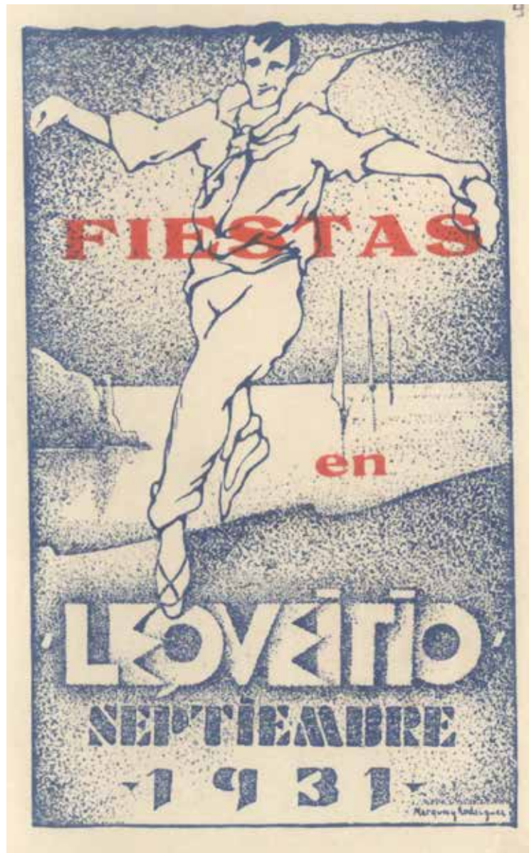
Lekeitioko 1931ko jai egitaraua. LUA

Erri-jayen Iragakari bakarra Lekeitio, Uri jator eta zintzo onetako Udal agurgarriak