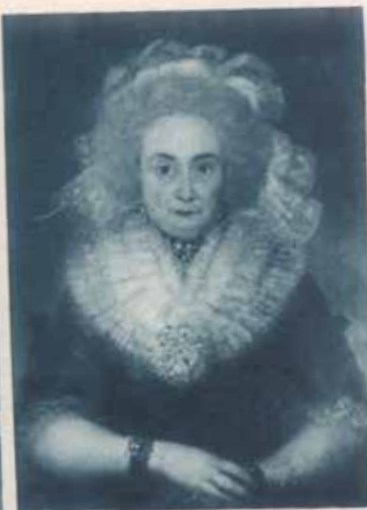
DOÑA RAMONA DE TAVIRA, RETRATO DE GOYA

Francia como en otras naciones. La fachada principal es admirable de proporciones, sobria y elegante en su decorado, con el gran balcón principal de estilo barroco, rematado por un ángel, graciosa escultura encerrada en una hornacina de piedra, como el resto de la fachada, que evoca el recuerdo de algunas construcciones madrileñas de la época de Churriguera, como el antiguo Hospicio y los palacios de Miraflores y de Oñate. La escalera es muy amplia, y la capilla, notableísima, encierra valiosas obras de arte.