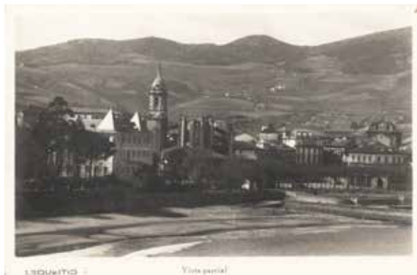
Kristalezko negatibo horretatik ateratako postala.