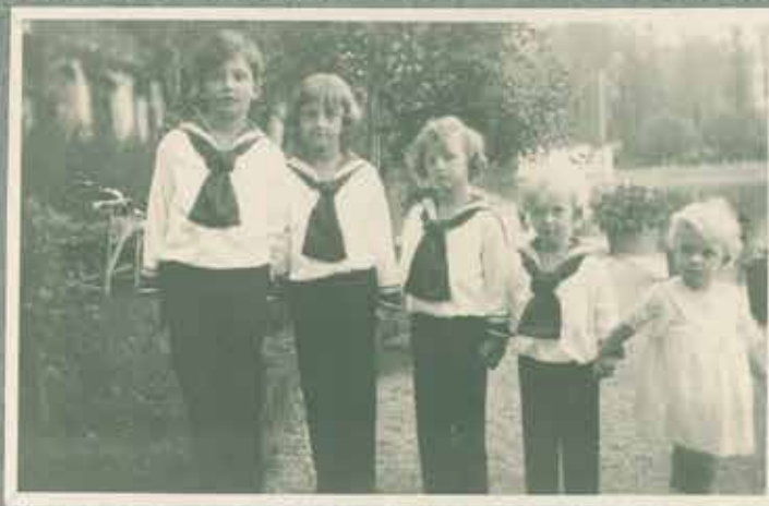
Archiduques: the eldest, Maria Carlota, and Rodolfo.

Principe de Asturias é infante Don Jaime = Reina María Cristina = Archiduque Maximiliano (hermano del difunto emperador Carlos), Archiduque Humberto, Salvador (yerno del emperador Francisco José), Principe Sixto de Borbón con su Señora, Principe Francisco Javier de Borbón, =