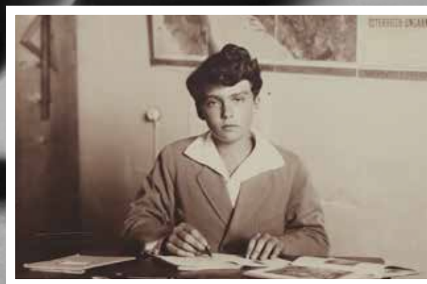
Otto Habsburgkoa enperadoregaia Lekeition, 1922