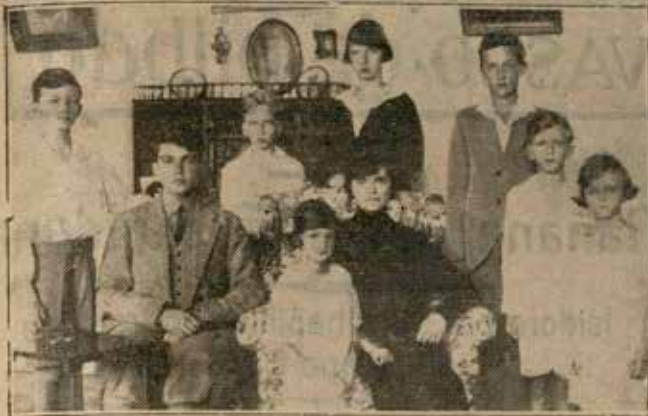
LA EMPERATRIZ ZITA DE BORBON RODEADA DE SUS AUGUSTOS HIJOS, LOS ARCHIDUCOS, EN UNA DE LAS HABITACIONES DEL HISTORICO PALACIO DE "URIBARREN", DE LEQUEITIO