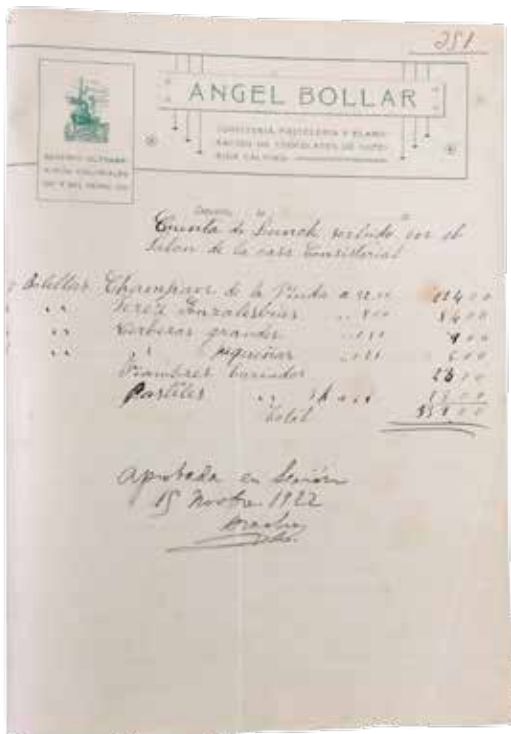
Lunch horren faktura. LUA L82/83

Se sirvió un lunch en el salón de sesiones y á las 6,30 salió el rey con su séquito para San Sebastian, muy agradecido al afectuoso recibimiento que hizo la villa lekeitiana.