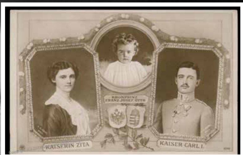
Francisco Carlos eta Zita kaiser-kaiserina eta Otto oinordekoa, 1916