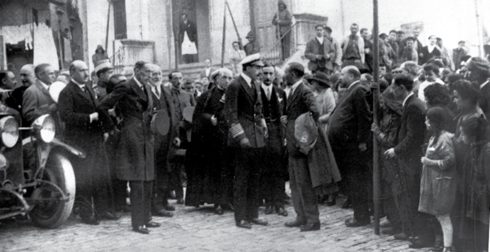
Alfonso XIII. udaletxe aurrean. LUA