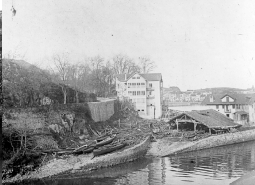
Mendietarren ontziola eta etxeak. Hasi dira konpontzen ontziola, amaitu beste kontu bat izango da.