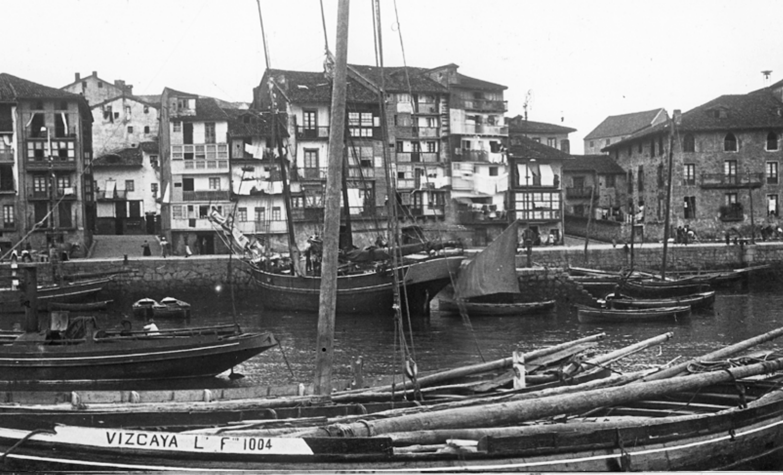
Vizcaya ontzia 1905ean egin zen eta Brau-txikiñarena zen.