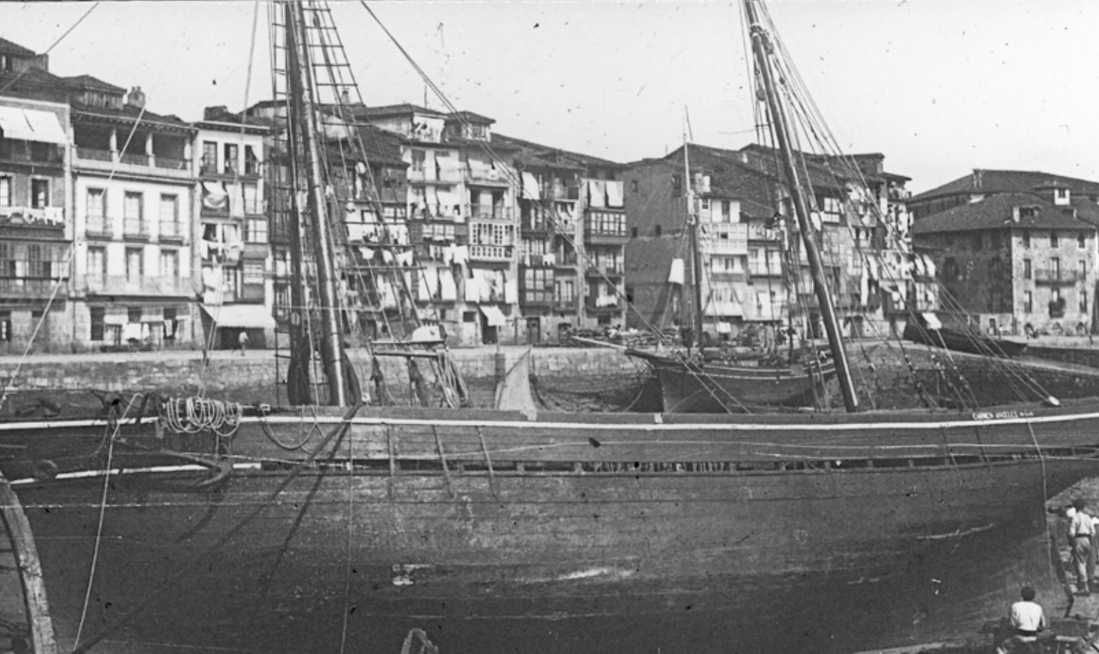
Carmen Angeles balandroa 1892an egin zuten Mendietatarren ontziolan.