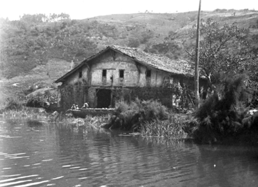
Errenteriako baserria Arropain auzoan