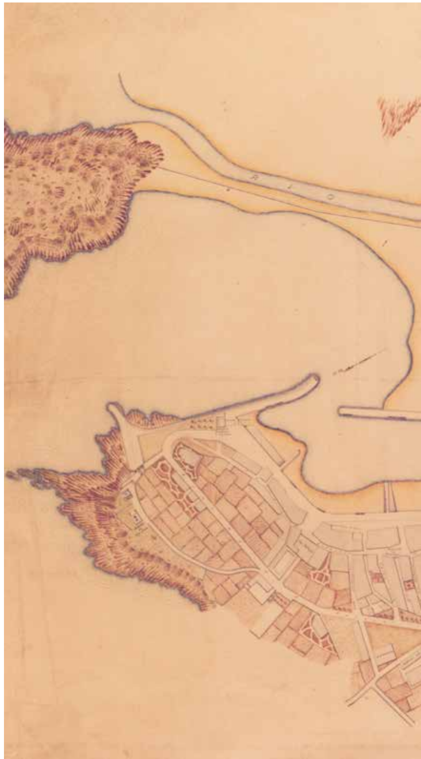
Lekeitioko plano, Juan Arancibia, 1913. LUA