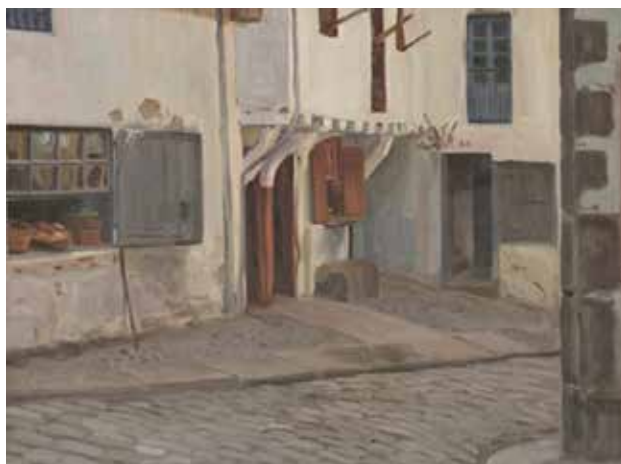
Vista de Lekeitio, Eduardo Chicharro, 1907

Lekeitiar karneta atera nahi duenak derrigorrez jakin behar dituen erantzunen artean dago gaur egungo Ezpeleta kalea Txitxarro kalea izan zela. XIX. mendeko udal aktetan behin eta berriro deituko zaio Chicharro calle Arranegi kaleko amaiera, errebal horri 1 . XX. mende hasieran jarri zioten Ezpeleta izena 2 . Harrigarria da, ehun eta piko urte beranduago lekeitiarrek Txitxarro kale deitzea kale horri, gogoratzea! Eta zer enbarkako guk Sa-rean? Chicharro pintorea Txitxarro kalea pintatzen!