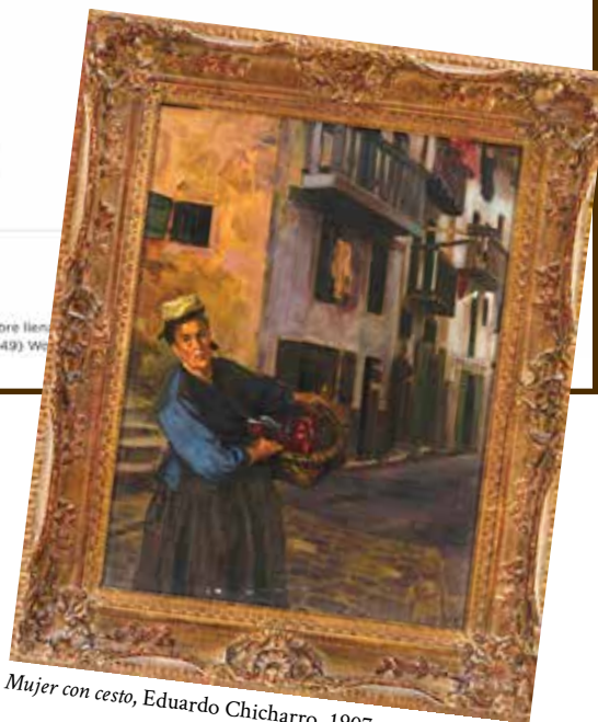
Mujer con cesto, Eduardo Chicharro, 1907