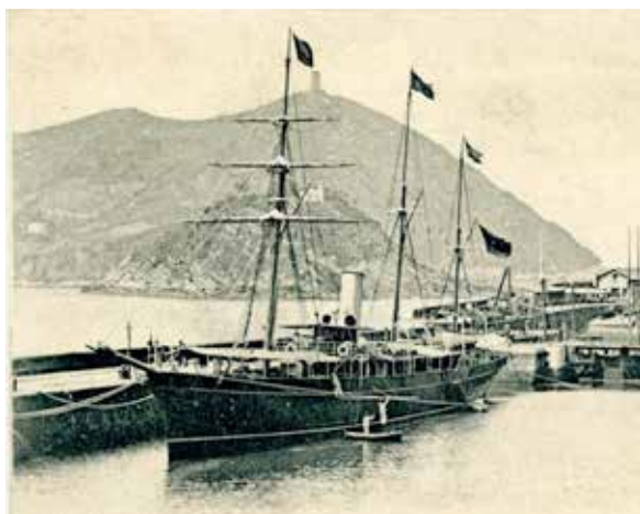
Urania Donostiako portuan