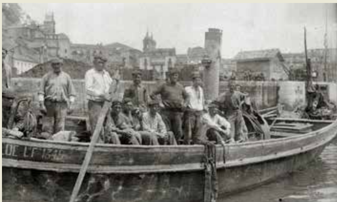
Clotilde bapora Donostiako portuan. Ricardo Martín, 1917. Kutxa Fototeka