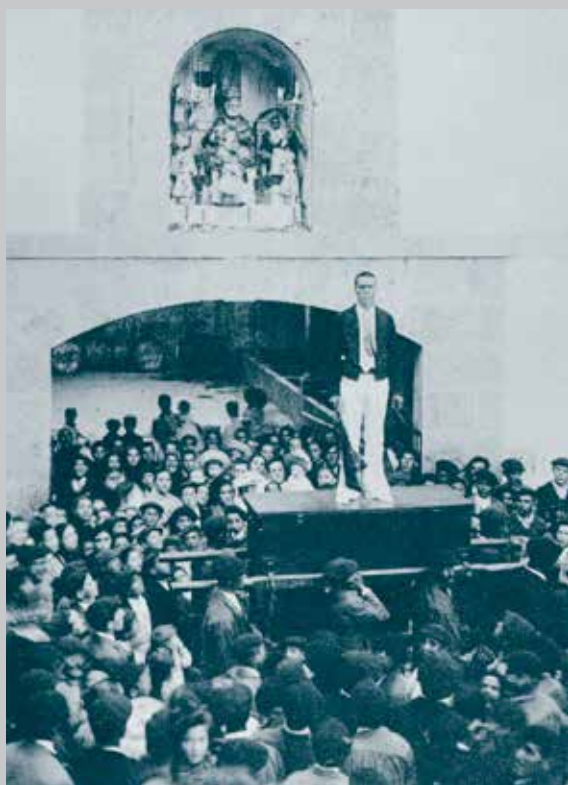
Kaxarranka, A. Guerequiz-en argazkia. Hauser y Meneten fototipia. Biblioteca Nacionala, Madril