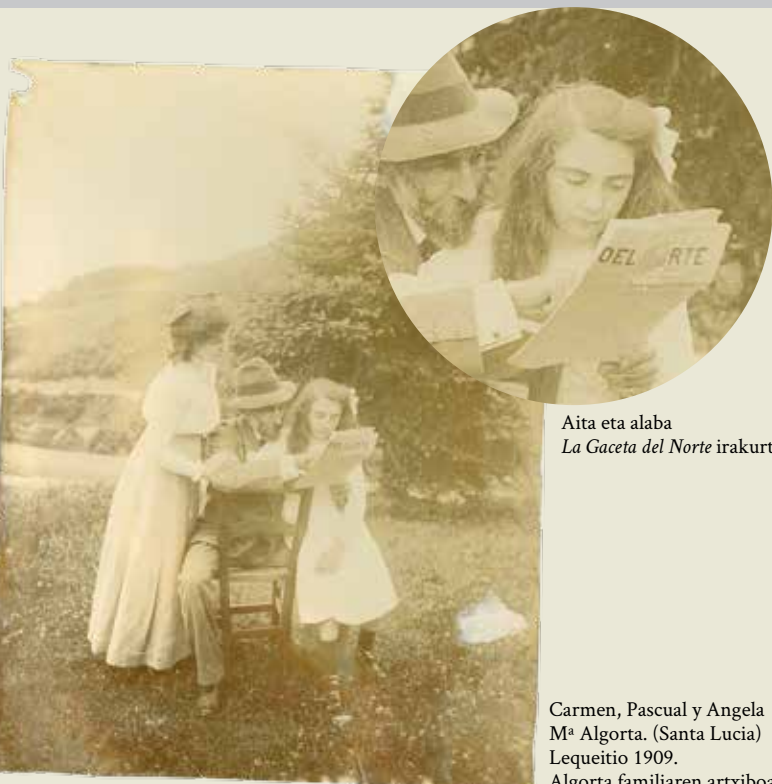
Aita eta alaba La Gaceta del Norte irakurtzen