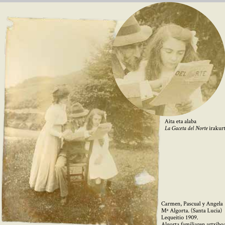
Aita eta alaba La Gaceta del Norte irakurtzen

https://w390w.gipuzkoa.net/WAS/CORP/DKPAZzokoPrentsaWEB/izenburuAurkibidea.do?lang=eu