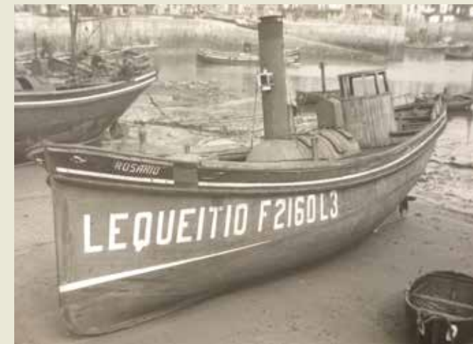
Rosario, Lequeitio F 2160 L3 (1927an egina)