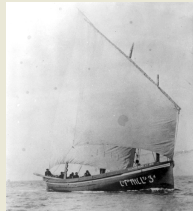
Kalbario mendi, L 100 F 10 1916 L TA 3 a (1922an egina)

1931-36 San Pedro BI-2239/Aita Guria BI-1-2386