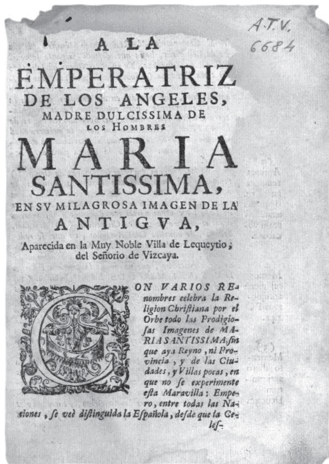
"Luz Concionatoria...". J. A. Ibañez de la Rentería. Sancho el Sabio fundazioa, EMD.

Christiandad tuvo Cultos esta Soberana Reyna en alguna situacion que se nos oculta. Lo que si se sabe por tradiciones heredadas de Padres á Hijos, que siglos antes que fuesse Villa Lequeytio, y mucho antes que se colocasse en el magnifico Templo, que oy tiene, era celebrada la Virgen Santissima de la ANTIGUA en su pequeña Hermita, que erigió la Devocion de los Fieles.