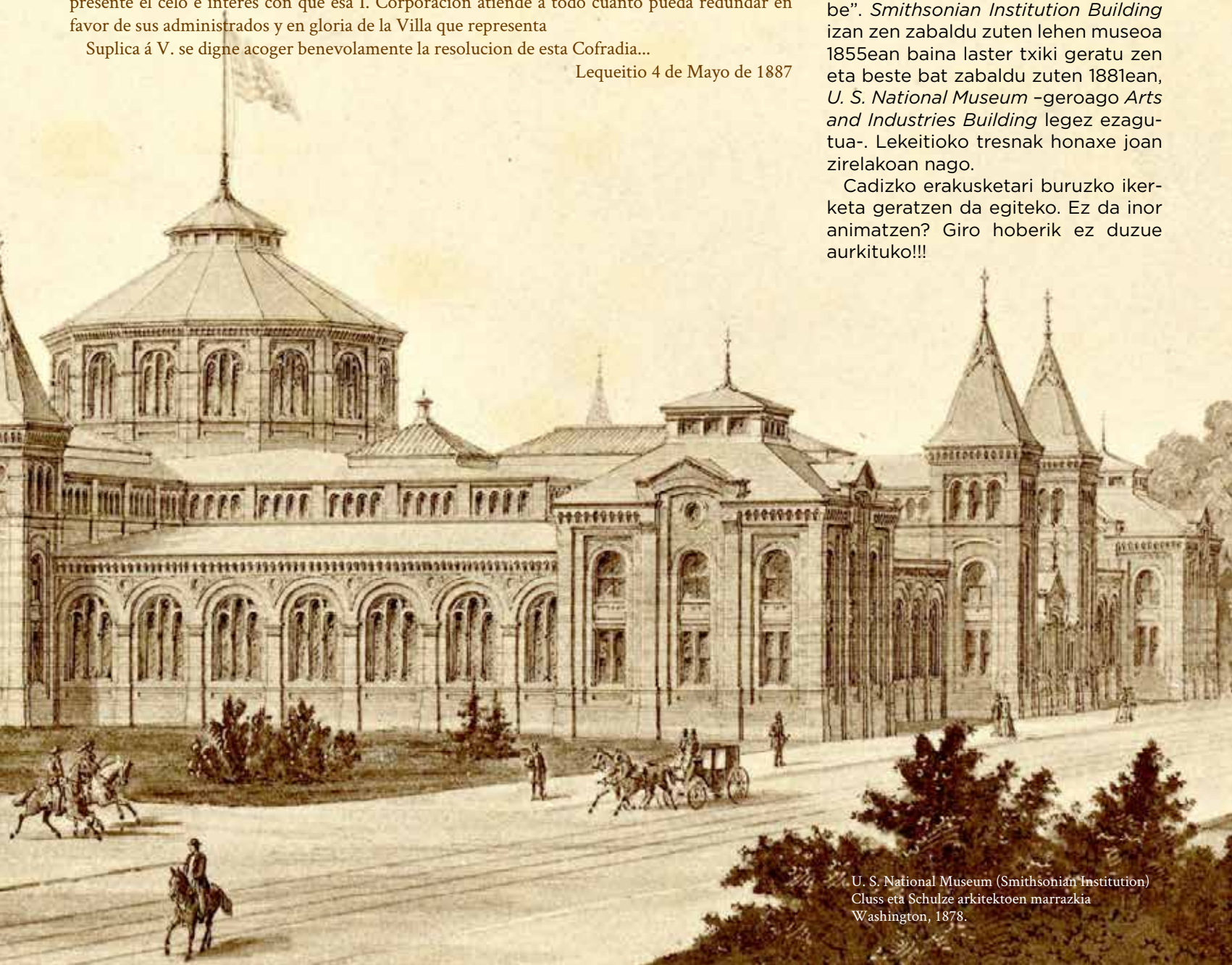
U. S. National Museum (Smithsonian Institution) Cluss eta Schulze arkitektoen marrazkia Washington, 1878.

Cadizko erakusketari buruzko ikerketa geratzen da egiteko. Ez da inor animatzen? Giro hoberik ez duzue aurkituko!!!