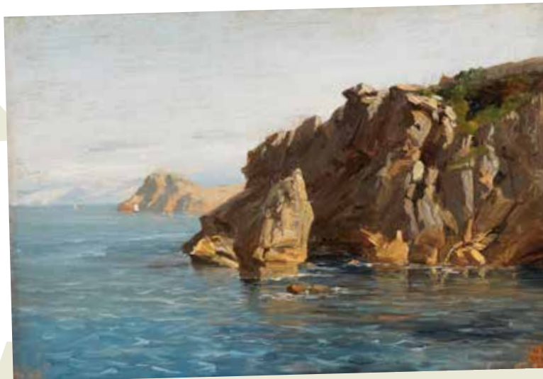
337 Rocas de Santa Catalina 25x35 (gaur egun Pradoko webgunean, Rocas de Santa Catalina, hacia 1872, P004384)