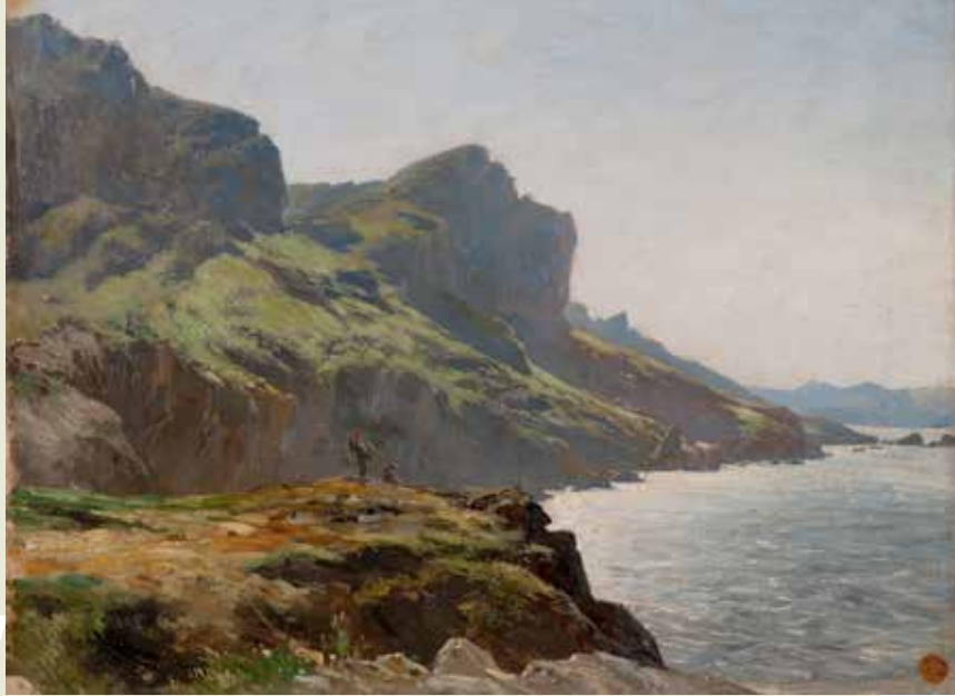
302 Rocas de Otoy 39x50 (gaur egun Pradoko webgunean, Rocas de Otoy (Lequeitio), 1866-1872, P007479)