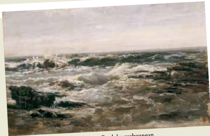
291 Rompientes 26x41 (gaur egun Pradoko webgunean, Rompientes (Lequeitio), hacia 1872, P006155)