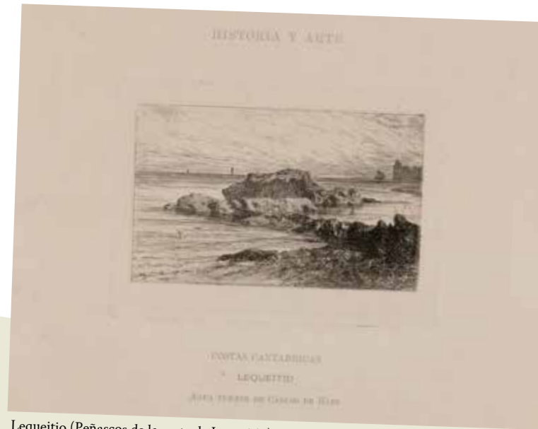
Lequeitio (Peñascos de la costa de Lequeitio), hacia 1862