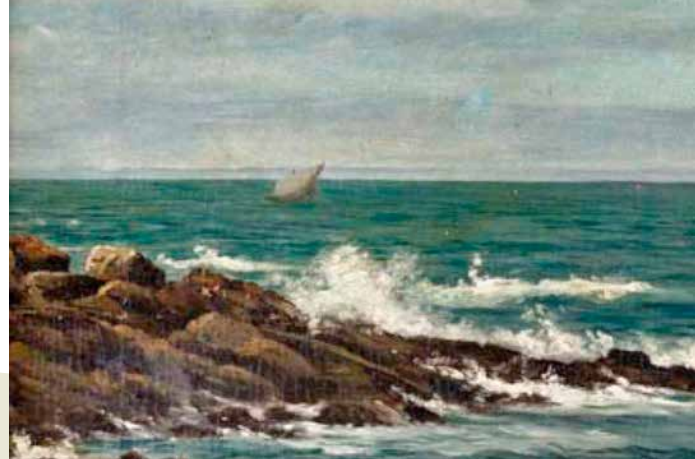
Rocas, Lequeitio 25x36, 1872. Enkantean saldutakoa 2017an