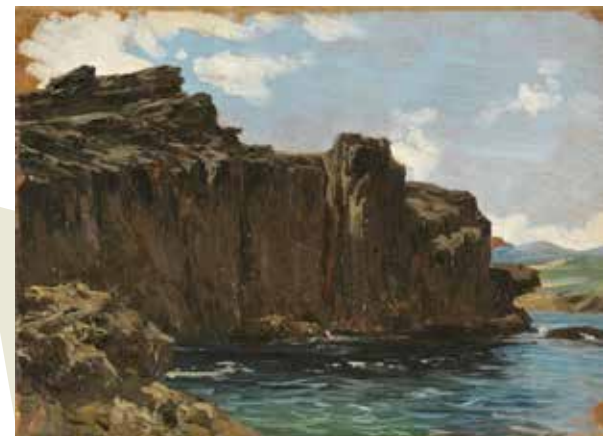
199 Acantilados 26x36 (gaur egun Pradoko webgunean, Acantilados (Lequeitio), hacia 1866, P007392)