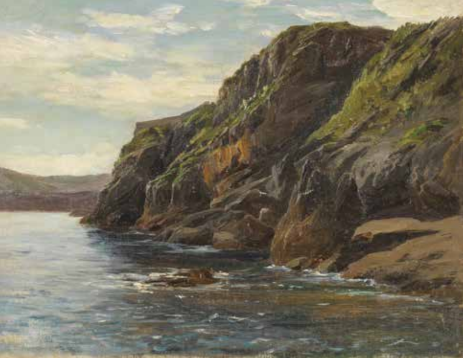
231 Costa de las cercanías de Lequeitio 31x40 (hau La Ilustración Española -n agertu zen) (gaur egun Pradoko webgunean, Costa de las cercanías de Lequeitio, hacia 1866, P007483)