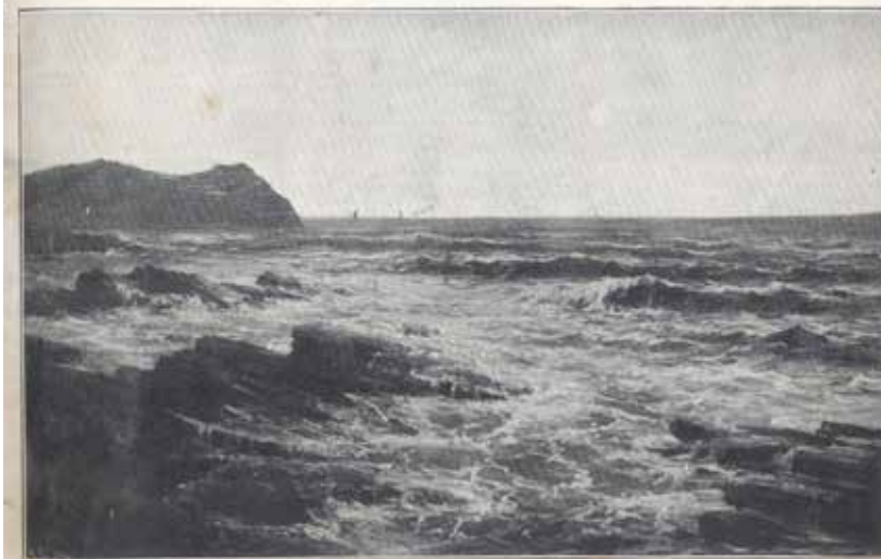
SALA DE HÀRE.—BOSTIAYES DE OLAS EN LA BAYONA.—(STR. 10 DEL CATALUÑA.) MADRID.—EXPOSICIÓN GENERAL DE BELLAS ARTES DE 1899.

Paisaia generoa berriztu zuen arren ez zen frantsesen antzera pleanirista izan: zirriborroak kalean egiten zituen baina koadroa tailerrean amaitzen zuen. Hori da irakurri dudana eta irakurri izan dut baita gurean -eta beste leku batzuetan- egin zituenak tamaina txikikoak zirela bidaiatzeko pintura-maletxoan kabitzeko. Baieztapenok egiak badira, zer ote dira Lekeitioko koadroak, amaitutako obrak ala zirriborroak? Edozein kasutan emaitza bikaina izan zen. 1899an, Estatuari utzi zizkion 200 obratik gora eta beste batzuk, erakutsi ziren urte hartako Arte Ederretako Erakusketan (La Epocaren arabera 299 estudios al oleo y multitud de dibujos y aguafuertes ).