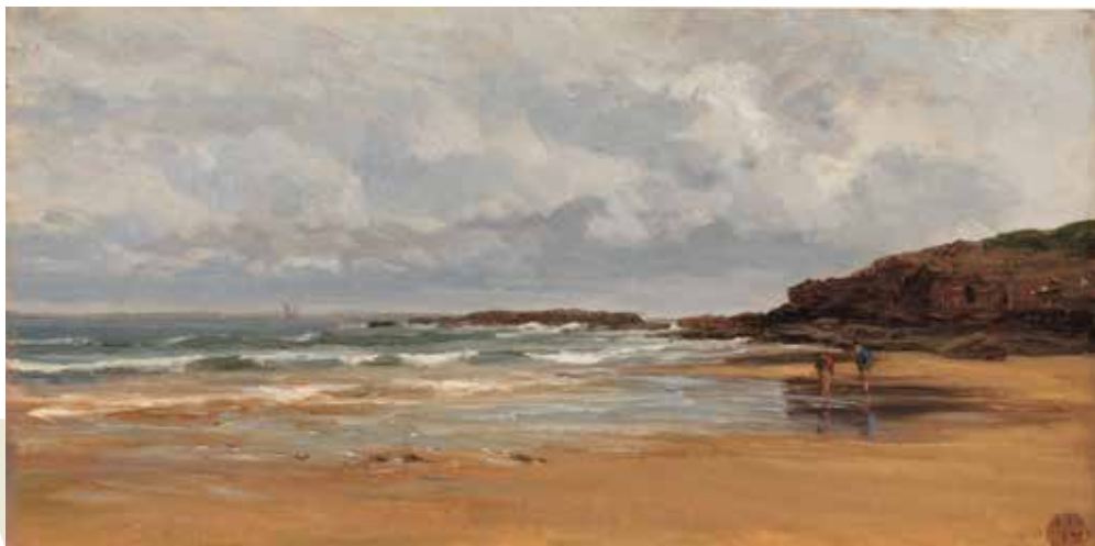
258 Playa de Carraspio 22x42 (gaur egun Pradoko webgunean, Playa de Carraspio, hacia 1866, P004379)