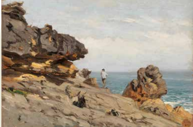
252 Atalaya 25x35 (gaur egun Pradoko webgunean, Playa de Lequeitio. Atalaya, hacia 1872, P004383)