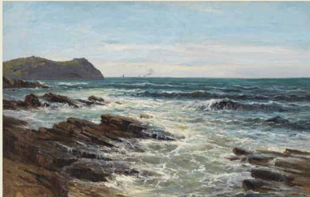
219 Rompiente de olas en Lequeitio (gaur egun Acantilados (Guéthary), hacia 1881, 38'5x 61, P005647)

Guk hemen egin duguna Javier Landeras argazkilariak ere egin zuen: "Pintando al genio del lugar, fotografiando la mirada del artista" Javier Landeras. Haru Asaki Editions, 2017