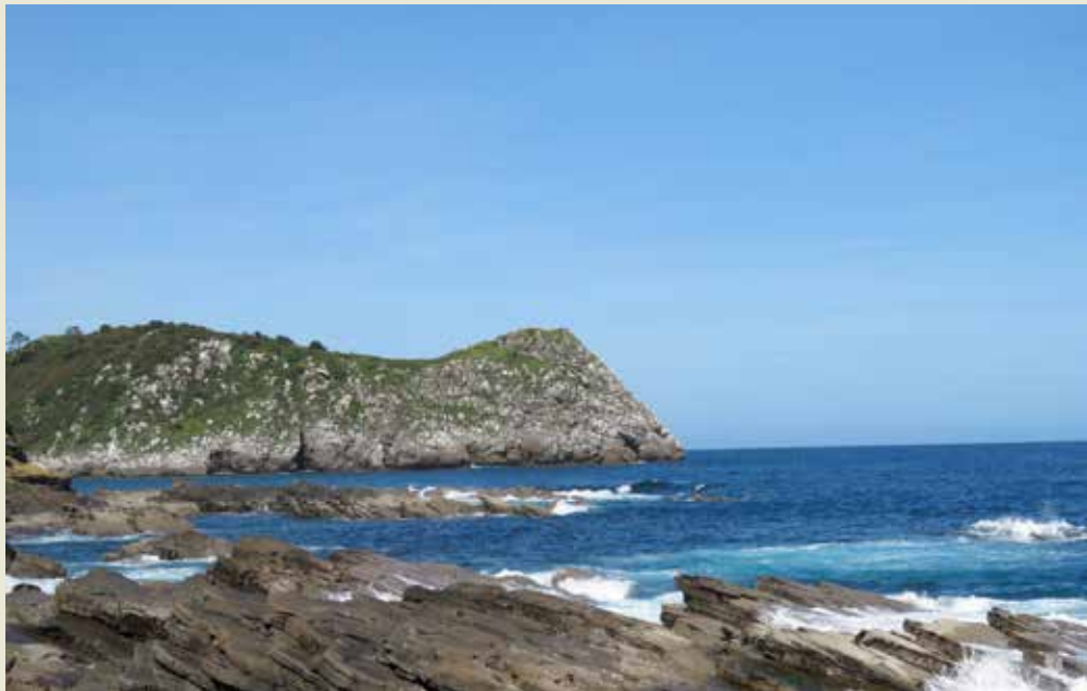
Garraitz irla Artzabaletik. (2019ko udaberria)

Gaur egun Pradoko museoan hurrengo obrak daude (1866-72): Rocas de Lequeitio , Acantilados (Lequeitio) , Playa de Carraspio (Lequeitio) , Rompiente de olas , Costa de las cercanías de Lequeitio , Playa de Lequeitio . Atalaya , Playa de Carraspio , Rompientes (Lequeitio) , Rocas de Otoyó (Lequeitio) , eta Rocas de Santa Catalina . Hamar olio guztira. Eta grabatu bat: Lequeitio (Peñascos de la costa de Lequeitio) , hau 1862 ingurukoa.