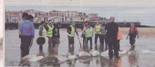
Udala, kanoia aztertzen, Fornder zasuaren babestua dute; indusketa lasak hasi arte heldu ez direla, izan dira. (10/11/2014)

XVIII mendeko kanoia ingelesa izan daitekeela uste dute arkeologoak, eta Lekeition dauden beste kanoiekin alderatuta desberdina dela diote.