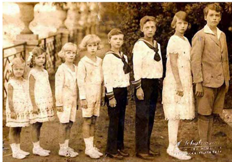
Zita enperatrizaren seme-alabak Uribarren jauregiko parkean.

Guzti hau esanda, gehitu nahi dut Arriolaren liburuak gauza interesgarriak eta jakingarriak erakusten dituela, baina bere erara eta gehiago jakin guran uzten bagaitu, hutsune oiek besteren batek bete beharko lituzkeela.