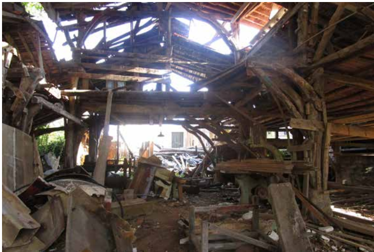
Mendieta ontziola egoera tamalgarrian.

Eta ezin isildu, ezin. Mendieta ontziola. Ederra itxura duena! Euskal monumentu historiko izendatuta dago, eta ia jaustekotan. Atabakan konbentzituta gaude ezin garela besoak gurutzatuta egon, nahiz eta arazo administratiboak ugariak izan. Uste dugu erakunde guztiek (Udala, Diputazioa, Jaurlaritza, Estatua) bat egin behar dutela monumentua berroneratzeko. Neurri batean, eroso daude bata besteari errua botatzen, baina ezin da geldirik egon. Borondatea behar da.