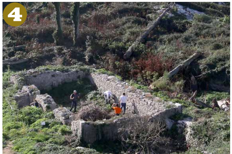
Kuartela edo guarnizioa.