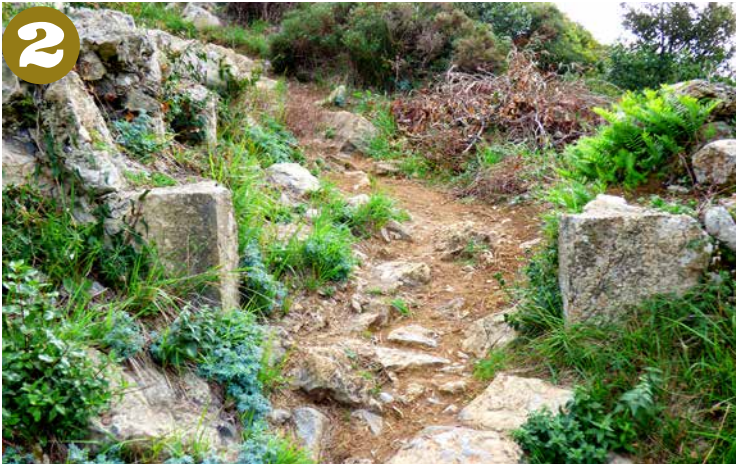
Eremu militarerra sartzeko atea.