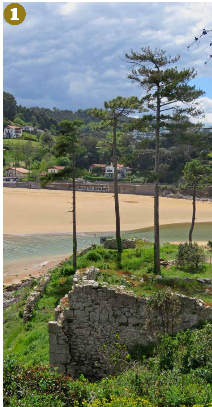
Ermitaren iparraldeko horma.

lijosoa eliztarrengandik banatzeko. Zorua ez da ikusten; lurra estalita dago orain, baina adreilu etzanez osatutakoa izango zen, arrain-hezurduraren antzera jarria (Sienan moduan). Hortxe azpian egongo da dena, 40-50 cm-ra edo. Dena azalerraten duzuenean, horrelako adreiluak beharko dituzue (Levante aldean egiten dituzte).