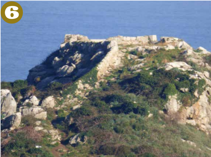
Isla muturreko bateria.