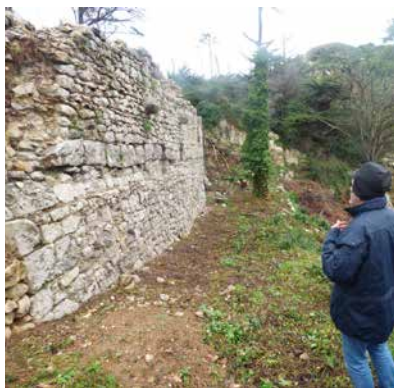
Santana ermitaren hormaren aurrean.

Hormaren aurrean jarri da. Albertok argi du lehenengo lerrorainoko lanak (harri eta lauz txikiko mailan amaitzen da) herri xeheak egindakoak direla, hau da, orduko lekeitiarrek; eta oso ondo, gainera. XV. mendean izango zen: “Hor daude harriboloak, oso ohikoak gotiko beranduko sasoiari”.