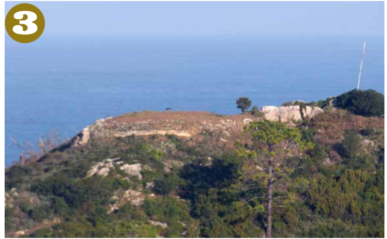
Tontorreko gotorlekuaren aztarnak.

Alfredok ondo dakien moduan, gotorleku hauek Bizkaiko Jaurreriko Batzar Nagusiek erabaki eta antolatzen zituzten; gatazkaren garrantziaren arabera, gehiago edo gutxiago hornitzen zituzten (bolbora, munizioa, tropak). Adibidez, Konbentzio Gerran (1795), frontea ez zen egon itsasaldean. Soldadu frantsesak Markinatik etorri ziren, eta ordukoxea da Lumentzako bateria: ez dago itsasora begira, barrura baino”. (Beste proiektu bat Atabakarentzat: Lumentza tontorrera joan, sastraka garbitu... Batzuetan latsa sentiarazten du Lekeitio inork zergatik ez duen hor ezer egin, bertako ikuspegi zoragarria erakusteko. Zer egingo diogu, bada!).