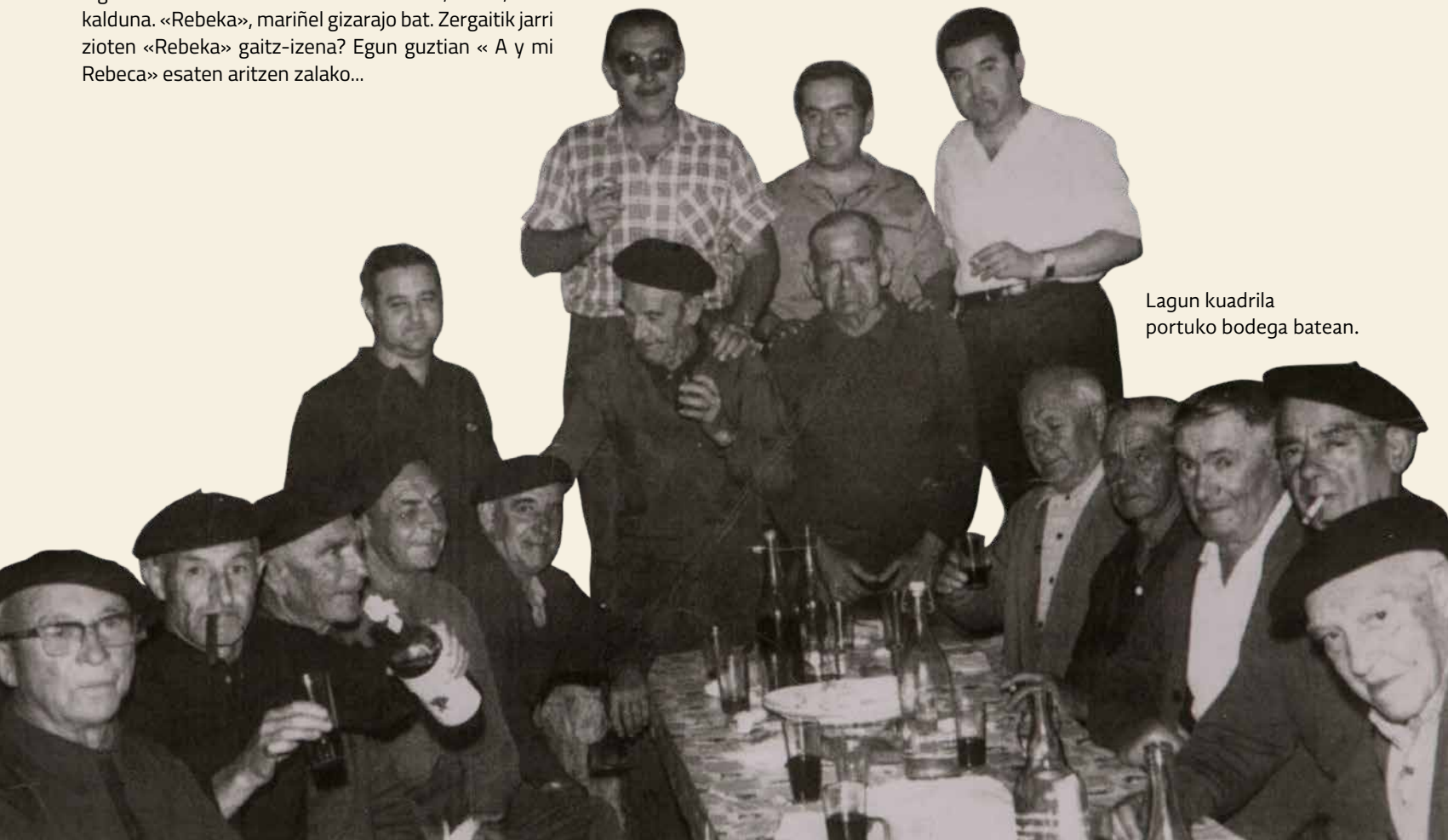
Lagun kuadrila portuko bodega batean.