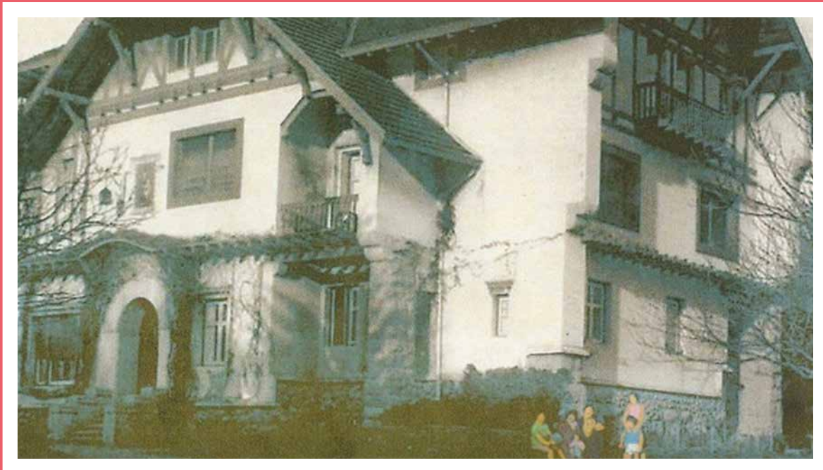
Solanotarren Mendexako etxea