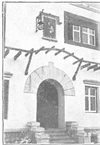
Detalle de la puerta principal.